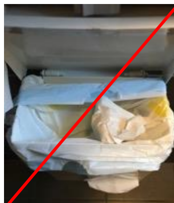
*Exemple d'obstruction sur une poubelle classique